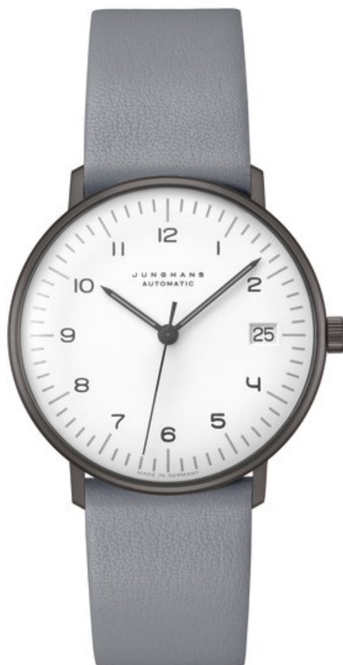
Junghans Max Bill Kleine Automatik Automatik, Datum Edelstahl, Saphirglas | 5 bar Ø 34 mm | 1.055 €