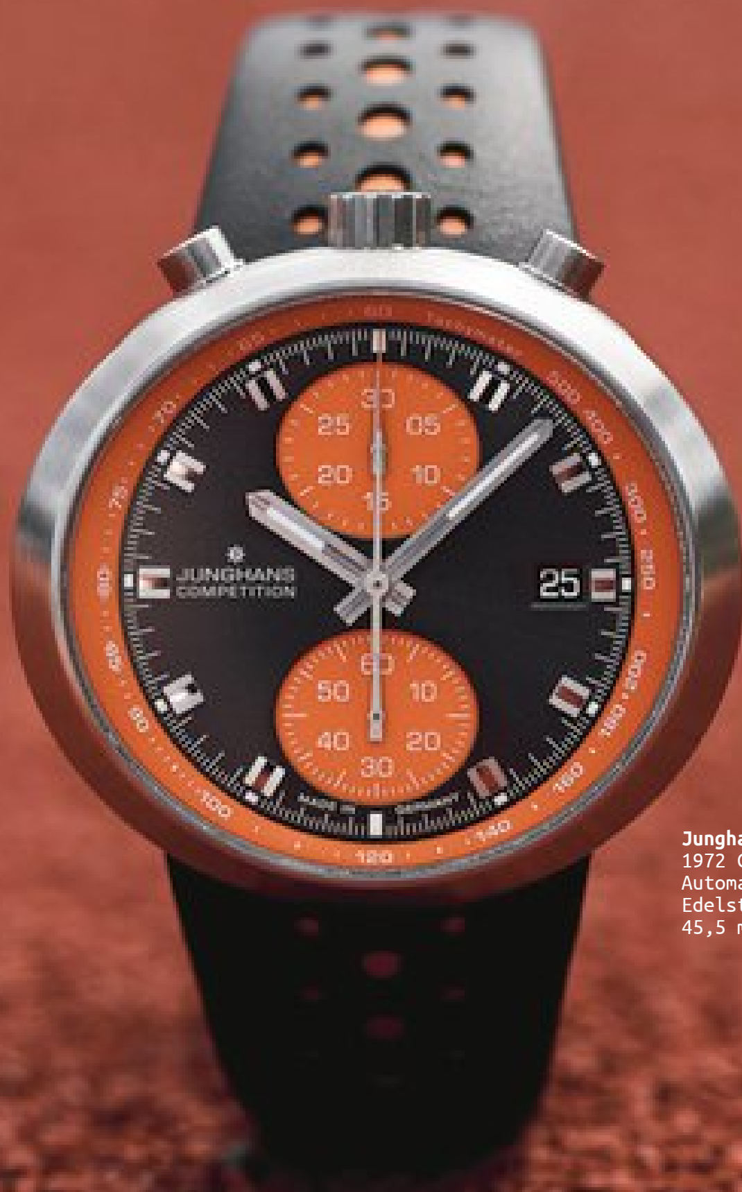
Junghans 1972 Competition Automatik, Chronograph, Datum Edelstahl | 10 bar 45,5 mm x 41,0 mm | 2.390 €