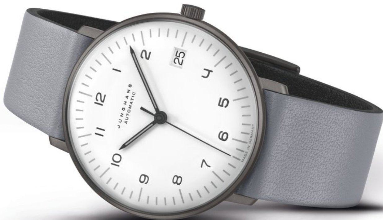
Junghans Max Bill Automatic Automatik, Datum Edelstahl, Saphirglas | 5 bar Ø 38 mm | 1.055 €