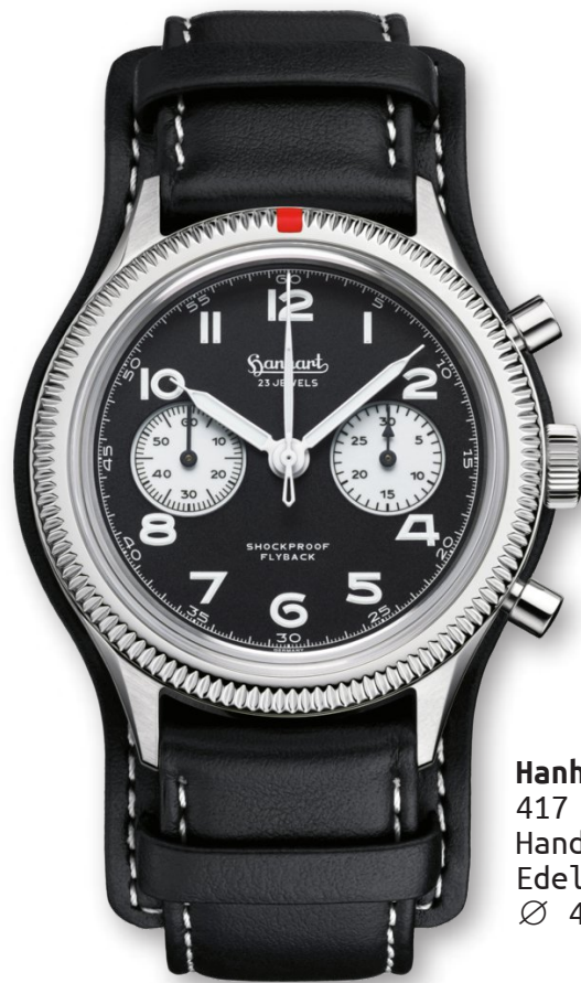
Hanhart 417 ES Handaufzug, Chronograph Edelstahl | 10 bar Ø 42 mm | 2.390 €

Sie werden sich jetzt sicher fragen, was ein Panda oder ein Reverse Panda mit dieser Hanhart zu tun haben kann? Die Erklärung ist ganz einfach und der Begriff Panda kommt von den Vintage Uhren bzw Chronographen mit einem hellen Zifferblatt und dunklen Hilfszifferblättern. Die dadurch entstehenden dunklen Kreise sehen wie die Augen eines Pandabären aus und deswegen nennen Sammler Uhren mit diesen Zifferblättern „Pandas“. Und bei einem „Reverse Panda“ ist es eben genau umgekehrt und helle Hilfszifferblätter durchbrechen ein dunkles Zifferblatt.