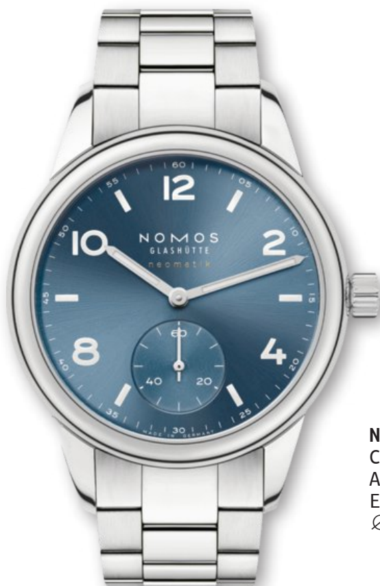
Nomos Glashütte Club Sport neomatik polar Automatik Edelstahl | 20 bar Ø 37 mm | ab 2.480 €

Mit der neuen Club Sport neomatik ist Nomos Glashütte ein großer Wurf gelungen. Die Manufaktur aus Glashütte ist für ästhetische und technische anspruchsvolle Uhren bekannt, hinsichtlich der Robustheit bzw. Wasserdichtigkeit musste man in der Vergangenheit aber bei dem einen oder anderen Modell Kompromisse eingehen. Nicht so bei den Club Modellen und im Besonderen nicht bei der neuen Club Sport neomatik. Das hochglanzpolierte Edelstahlgehäuse mit einem Durchmesser von 37 mm schmiegt sich dank des neuen satinierten und polierten Metallbandes perfekt ans Handgelenk.