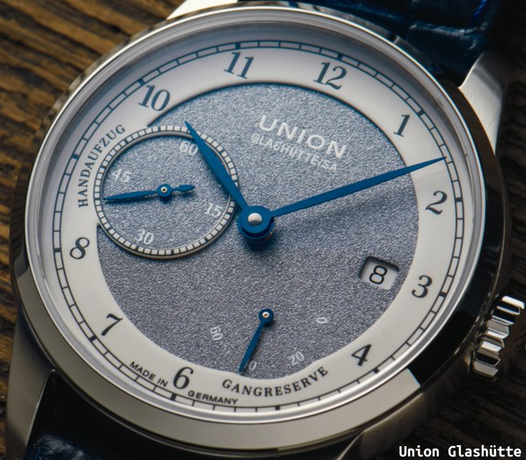
Union Glashütte 1893 Johannes Dürstein Edition Handaufzug, Datum Gangreserve Edelstahl | 10 bar Ø 41 mm | 2.480 €

Die Modelllinie 1893 der deutschen Uhrenmarke Union Glashütte erinnert an die Entstehung der Marke im Jahr 1893 und so haben die Uhren dieser Linie immer einen historischen Bezug zu den Ursprüngen der Marke. So wie auch das hier vorgestellte neue und bemerkenswerte Modell 1893 Johannes Dürstein Gangreserve. Besonders auffällig und unkonventionell ist bei dieser Uhr das Zifferblatt, welches im inneren Teil sandgestrahlt und blaugrau galvanisiert wurde. Der äußere Ring mit der Minuterie ist mit einem speziellen Emaillack veredelt und erinnert in Kombination mit den gebläuten Zeigern an die historischen Wurzeln in Glashütte, was einfach großartig aussieht. Wie schon der Name der Uhr vermuten lässt, ist dieses Modell mit einer