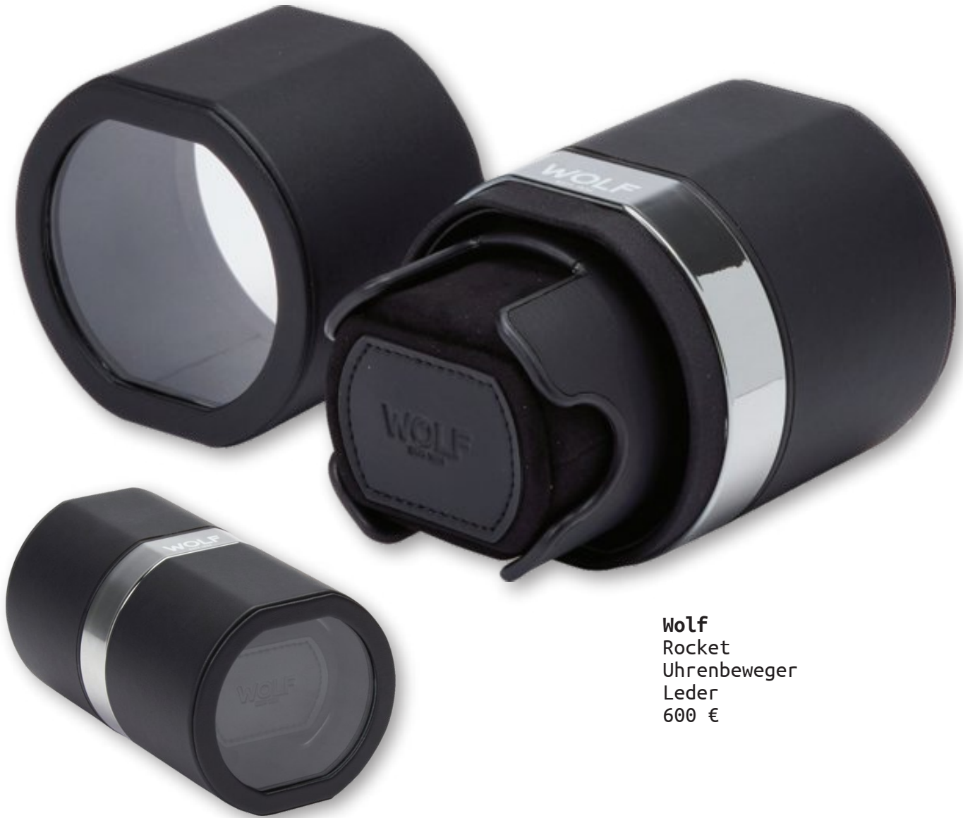
Wolf Rocket Uhrenbeweger Leder 600 €

Die Firma Wolf aus England produziert neben sehr schönen Uhrenboxen auch Uhrenbeweger in einer überdurchschnittlichen Qualität. Das neueste Modell aus der Kollektion trägt den Namen „Rocket“ und das sehr kleine Gerät sieht tatsächlich ein bisschen wie eine Raketenstufe aus. Wobei wir gleich beim Sinn dieses Gerätes wären. Automatikuhren brauchen Bewegung, damit sie funktionieren können. Jede Armbewegung wird über ein spezielles Getriebe genutzt, um die Zugfeder der Uhr zu spannen, damit sie präzise die Zeit anzeigt. Oft ist es aber so, dass der Träger tagsüber zu wenig Bewegung macht und dann baut die Uhr zu wenig Gangreserve auf bzw. kann die Uhr auch stehen bleiben. Für diesen Einsatzzweck gibt es