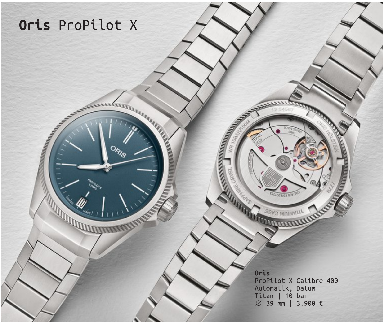
Oris ProPilot X Calibre 400 Automatik, Datum Titan | 10 bar Ø 39 mm | 3.900 €

Mit der neuen ProPilot X Calibre 400 setzt Oris ein Statement und bewegt sich mit einem neuen Design auf ein komplett neues Terrain. Mit der ProPilot X bewegt sich Oris weg von der Vergangenheit hin zu einem neuen und moderneren Design. Die Grundelemente des klassischen Designs bleiben zwar auch bei der ProPilot X erhalten, aber die Uhr wirkt insgesamt etwas kantiger. Das Gehäuse und das Metallband sind aus Titan – einem leicht gräulichen, extrem leichten und widerstandsfähigen Material. In Verbindung mit dem blauen, körnigen Zifferblatt und dem kantigen Metallband sieht die Uhr richtig cool aus. Natürlich ist die ProPilot X auch