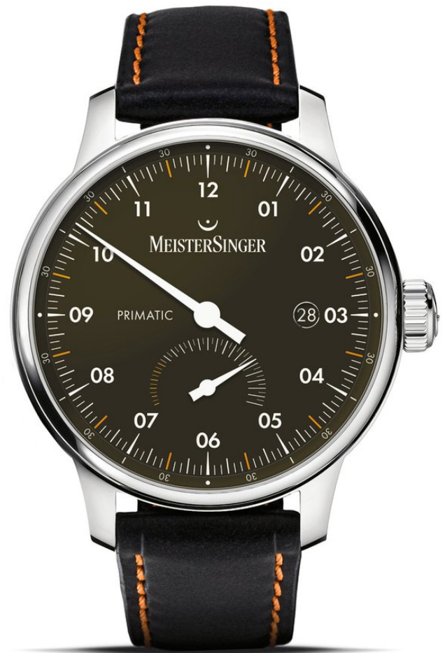
Meistersinger Primatic Automatik, Datum, Gangreserve Edelstahl | 5 bar Ø 41,5 mm | 2.190 €

Meistersinger ist eine ganz besondere Marke. Ein einzigartiges Design und das kompromisslose Bekenntnis zur Ein-Zeiger-Uhr machen die deutsche Uhrenmarke aus. Die Idee und das Design stammen aus Münster, entwickelt und gebaut werden die unverwechselbaren Uhren in der Schweiz. So treffen sich deutsches Design und